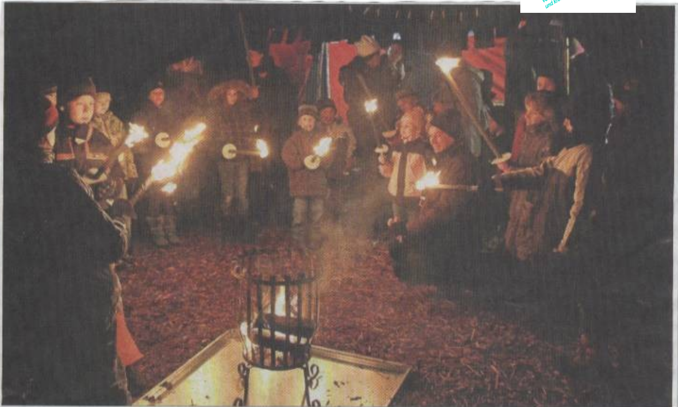
Die kleinen Marktbesucher erhielten vom Team A.p.e. e.V. Fackeln, mit denen sie bei Einbruch der Dunkelheit eine Waldwanderung unternahmen.